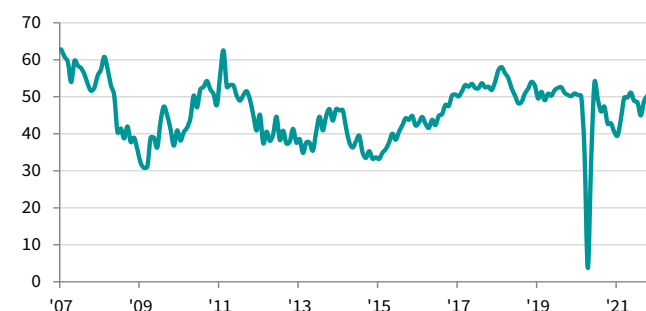
Indice de l'activité globale du secteur de la construction français cvs, >50 = amélioration par rapport au mois précédent