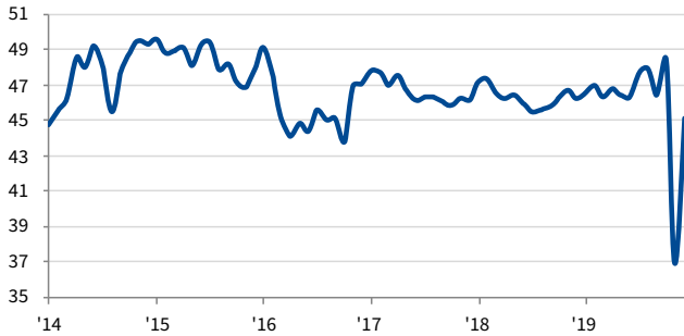
مؤشر PMI للبنان معدل موسميًا: 50 = تحسن منذ الشهر الماضي