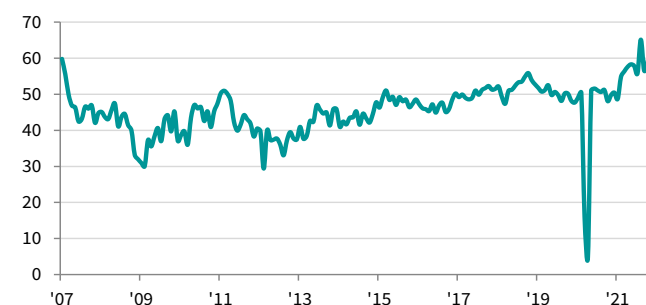
Indice PMI della Produzione Edile Totale in Italia destagionalizzato, >50 = miglioramento rispetto al mese scorso