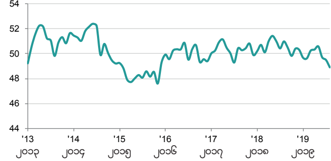
အာဆီယံ ထုတ်လုပ်မှု PMI ရာသီအလိုက် ညွှန်န်း >၅၀ =ယခင်လ နောက်ပိုင်း တိုးတက်ခဲ့