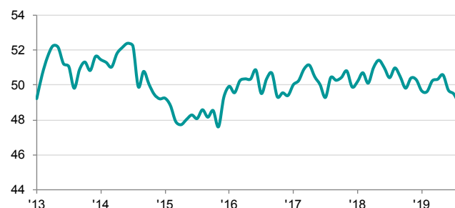
ASEAN Manufacturing PMI sa, >50 = pag-unlad mula noong nakaraang buwan