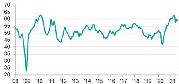
臺灣製造業PMI >50 = 較上月好轉 (經季節調整)