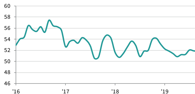
Philippines Manufacturing PMI sa, >50 = pagganda mula noong nakaraang buwan