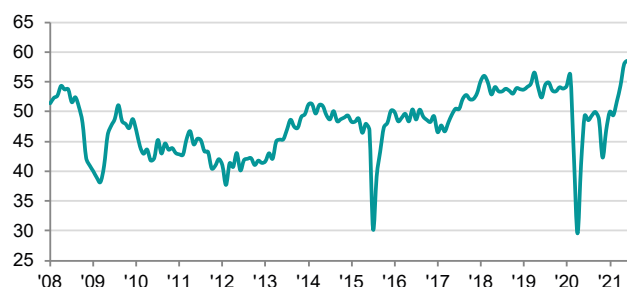
Ελλάδα PMI Τομέας Μεταποίησης επ.πρ., >50 = βελτίωση σε σύγκριση με τον προηγούμενο μήνα