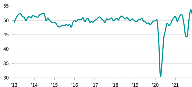
ASEAN Manufacturing PMI sa, >50 = pag-unlad mula noong nakaraang buwan