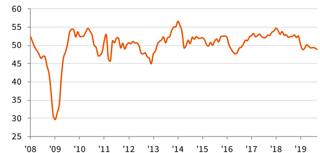
じぶん銀行 日本製造業PMI 季節調整済み、>50 = 前月比で改善