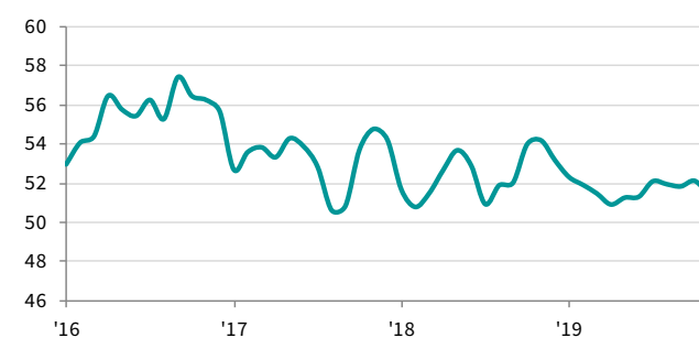
Philippines Manufacturing PMI sa, >50 = pagganda mula noong nakaraang buwan