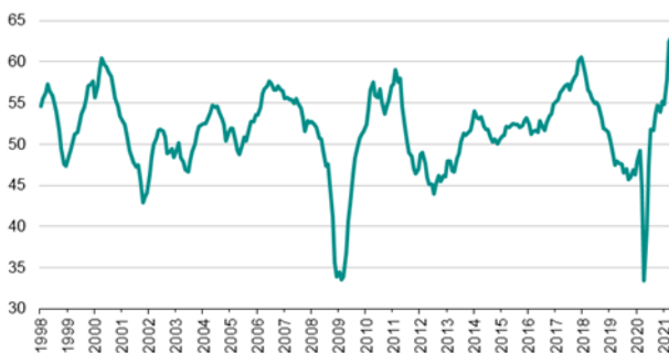
Indice PMI pour l'industrie manufacturière de la zone euro, cvs, 50 = sans changement