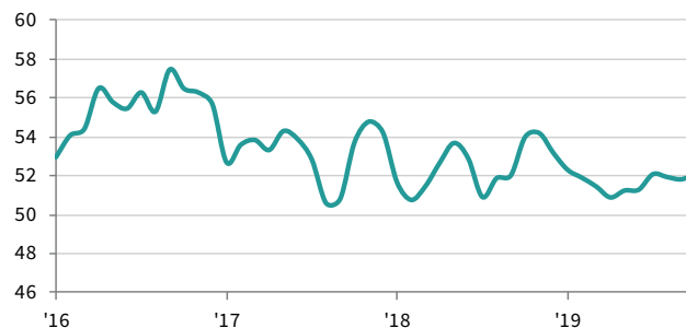
Philippines Manufacturing PMI sa, >50 = pagganda mula noong nakaraang buwan