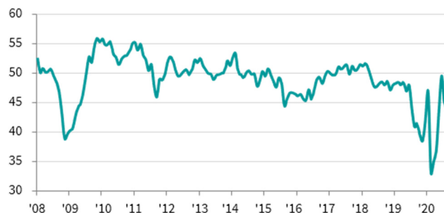
香港特區採購經理指數 (PMI) >50 = 較上月好轉 (經季節調整)