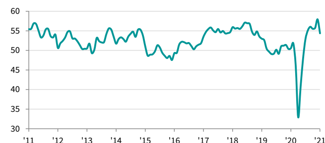
PMI pour le secteur de la fabrication canadien cvs, >50 = amélioration par rapport au mois précédent