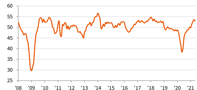
auじぶん銀行 日本製造業PMI 季節調整済み、>50 = 前月比で改善