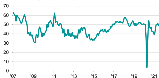
Indice de l'activité globale du secteur de la construction français cvs, >50 = amélioration par rapport au mois précédent