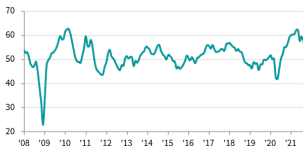
臺灣製造業 PMI >50 = 較上月好轉 (經季節調整)