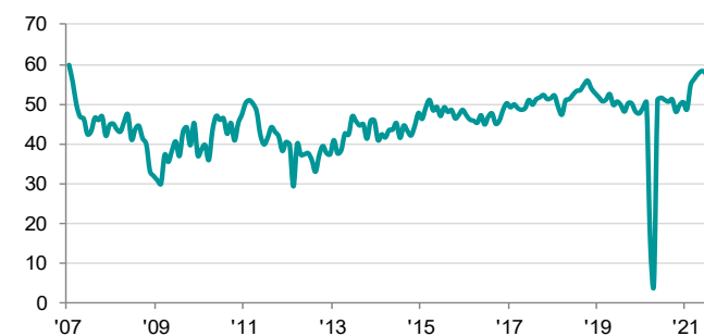
Indice PMI della Produzione Edile Totale in Italia destagionalizzato, >50 = miglioramento rispetto al mese scorso