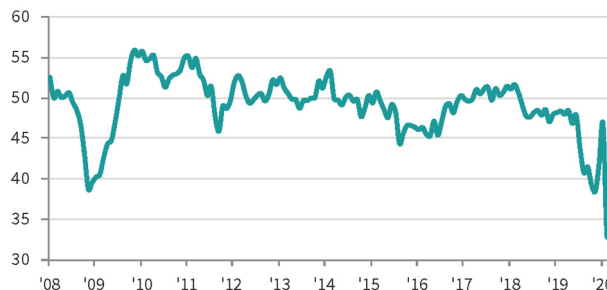
香港特區採購經理指數 (PMI) >50 = 較上月好轉 (經季節調整)