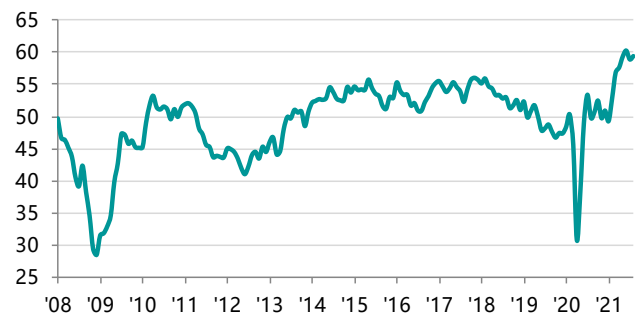
Índice PMI Sector Manufacturero c.v.e., >50 = mejora desde el mes anterior