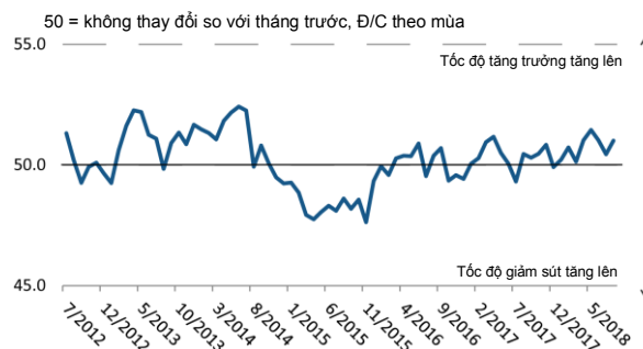
Nguồn: Nikkei, IHS Markit