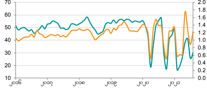
ထုတ်လုပ်မှု အညွှန်းကိန်း အေ, > ၅၀ = ပြီးခဲ့သည့်လနောက်ပိုင်း တိုးတက်မှု အော်ဒါသစ်များ : ထုတ်ကုန်လက်ကျန်စားရင်း အချိုး အော်ဒါသစ်များအညွှန်း/ သို့လျော့ထားသည့် ကုန်ရောင်း အညွှန်း

နောက်ဆုံးအနေဖြင့် ထုတ်လုပ်ရေးကဏ္ဍတစ်ဝန်းက အကောင်းမြင်စိတ်မှာ စစ်တမ်းသမိုင်းတွင် ပထမဦးဆုံး အကြိမ် အနုတ်လက္ခဏာ နယ်ပယ်ထဲသို့ လျော့ဆင်းသွားခဲ့သည်။ တတိယ သုံးလပတ် အလယ်ပိုင်းတွင် ဝယ်ယူအား အခြေအနေ အားပျော့လာကာ စက်ရုံများ ပိတ်ထားခြင်းနှင့် ကိုဗစ်-၁၉၏ ရေရှည် အကျိုးသက်ရောက်မှုများက မျှော်လင့်ချက်များအပေါ် လေးလံစွာ ဖိစီးခဲ့ကြသည်။