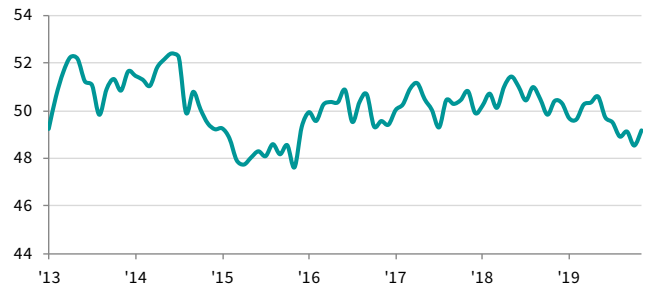
ASEAN Manufacturing PMI sa, >50 = pag-unlad mula noong nakaraang buwan