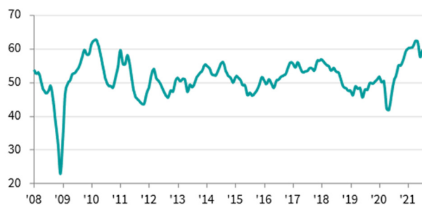
臺灣製造業 PMI >50 = 較上月好轉 (經季節調整)