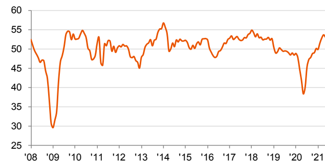
auじぶん銀行日本製造業PMI 季節調整済み、>50 = 前月比で改善