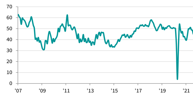
Indice de l'activité globale du secteur de la construction français cvs, >50 = amélioration par rapport au mois précédent