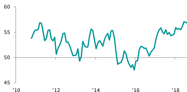
Indice PMI pour le secteur de la fabrication cvs, >50 = amélioration par rapport au mois précédent

Les fabricants canadiens signalent de nouveau une forte détérioration des performances des fournisseurs, tendance qu'ils attribuent généralement à des contraintes de capacité dans le secteur des transports et à des stocks insuffisants chez les fournisseurs. Le taux d'allongement des délais de livraison affiche toutefois son plus faible niveau depuis janvier.